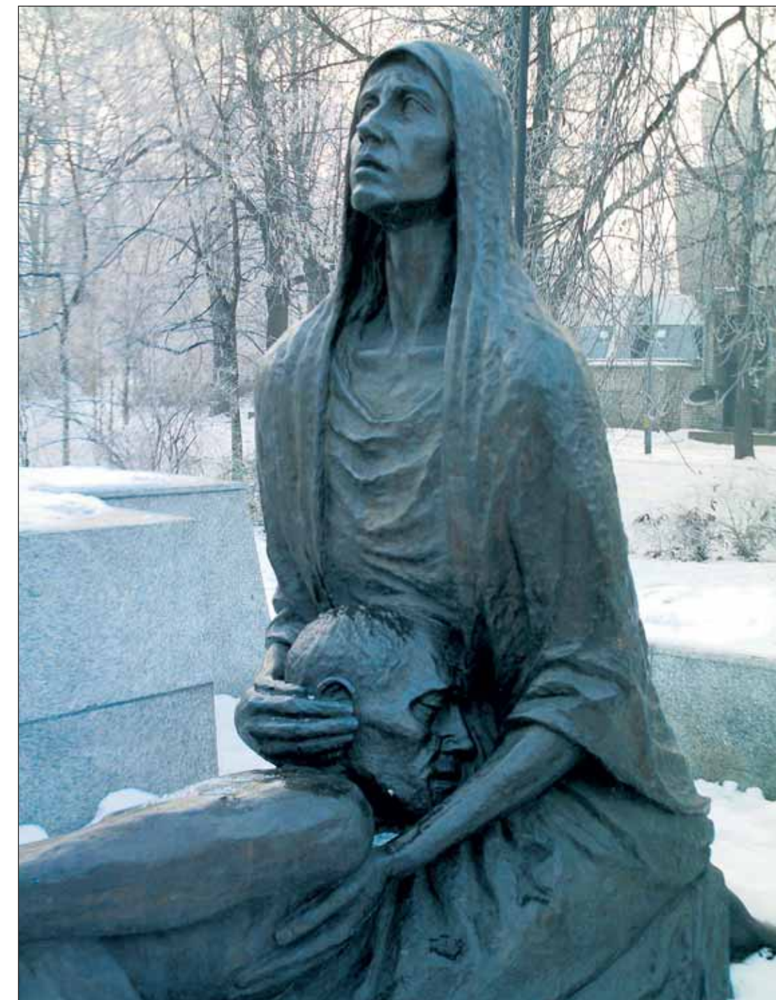
Katynin uhrien muistomerkki Wrocławissa.

Zubr metsästettiin lähes sukupuuttoon 1900-luvun alussa, kunnes se rauhoitettiin ja nykyään niitä voi nähdä luonnomukaisesti elävinä vain Puolan koillisosassa Białowelan kansallispuistossa.