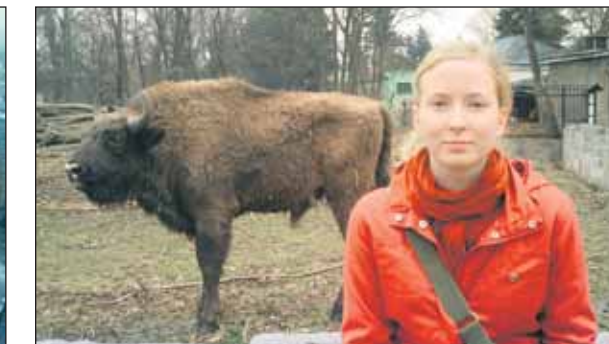
Taustalla hyvin pienikokoinen zubr Wrocławin eläintarhassa.