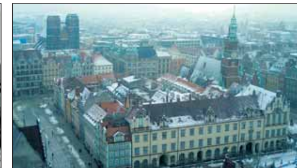
Wrocławin rynek talvella.