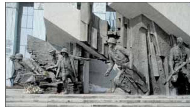
Vuoden 1944 Varsovan kapinan muistomerkki.

Zubr on Euroopan suurin maanisäkäs, joka voi kasvaa jopa 700 kiloiseksi.