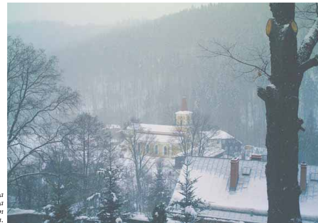
Talvimaaisema Wojtowicessa lähellä Tsekin rajaa.