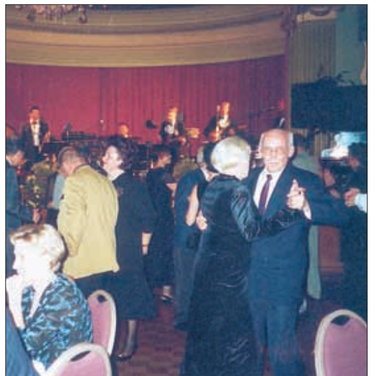
Parketti täyttyi hetkessä.