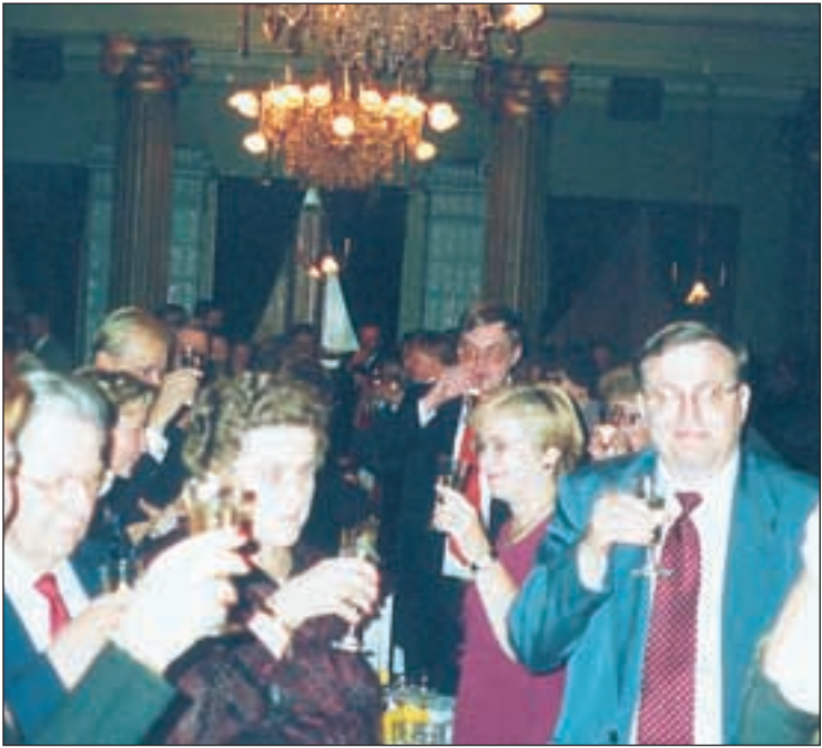
Malja juhlivalle yhdistykselle.