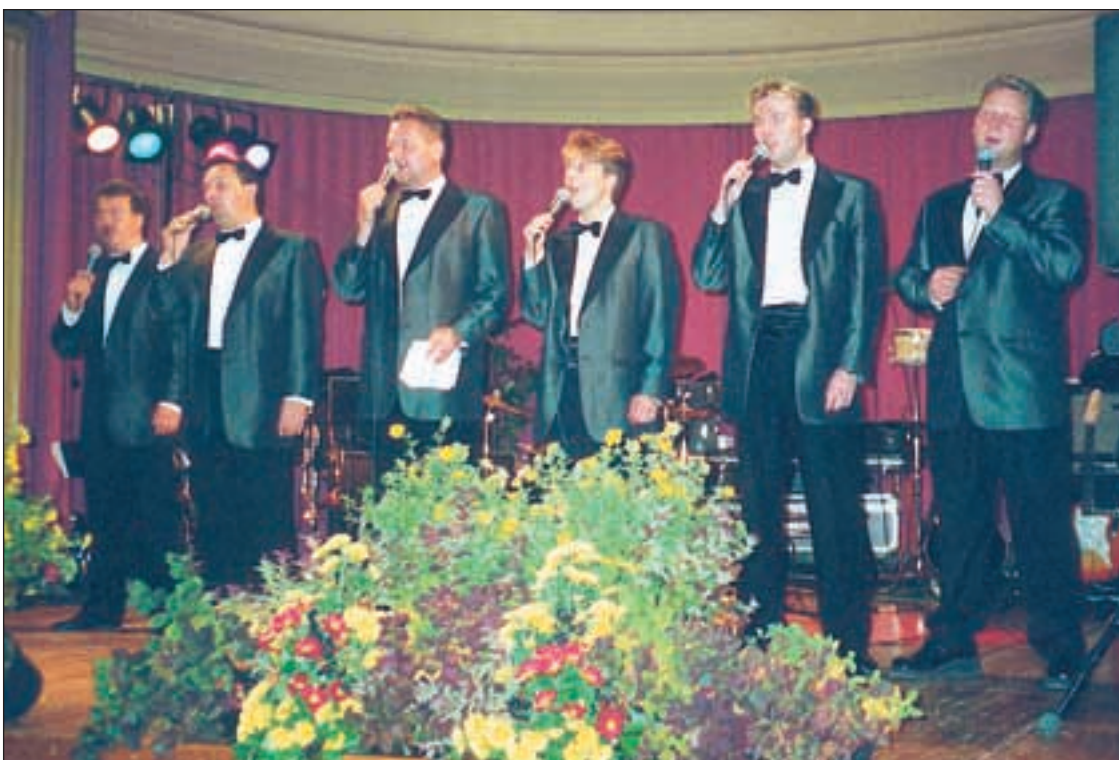
Tanssimusiikista huolehti Finlanders.