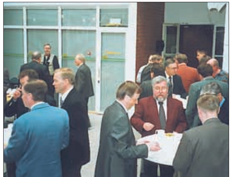
Myös tauolla käytiin vilkasta keskustelua.