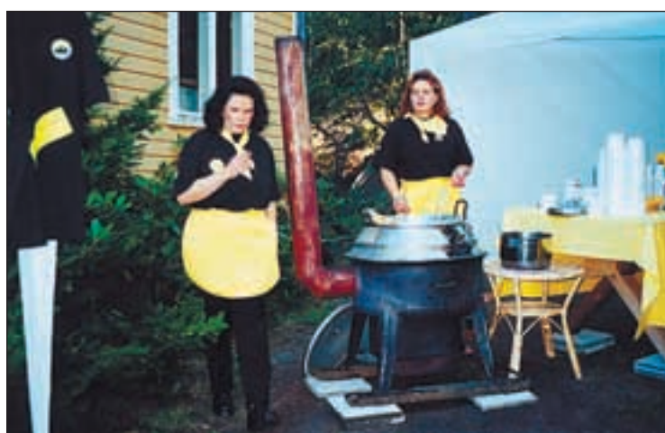
Emännät valmistautuvat ruuan jakoon.

Rantakulman VPK kävi kahden auton edustuksella esittytymässä. Vettä pumpattiin merestä letkuihin, joista se pruuttattiin takaisin, mikä oli ihan hyvä, ettei Pitkäsalmi päässyt kuivumaan. Myös lapset pääsi-