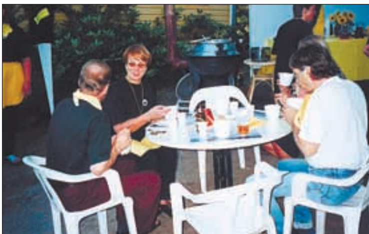
Ruoka maittoi juhlaiväelle.

vät kokeilemaan miltä tunuu olla ruiskussa kiinni. Poikia kiinnosti paloautot ja niiden kalusto, tyttöjä taas palomiehet.