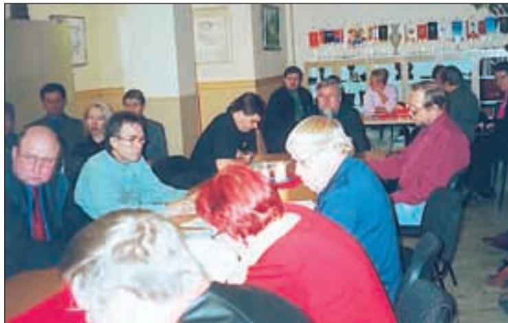
Syyskokoukseen osallistui n. 30 yhdistyksen jäsentä.