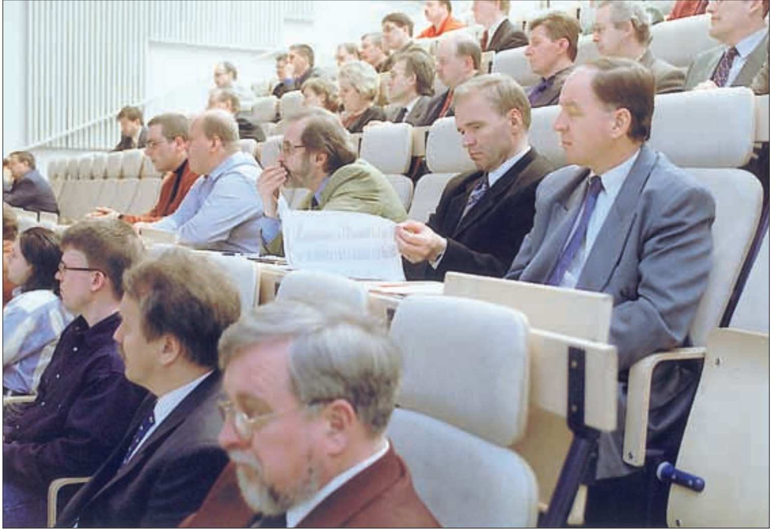
Seminaariyleisö koostui kutsuvieraista ja yhdistyksen jäsenistöstä.

Sutisen mielestä myös jatkossa tarvitaan työehtosopimuksia. Paikallistasolla voidaan sopia yksityiskohdat, muuttaa ns. raamisopimus sovitaan liittotasolla. Sutisen mielestä sopimustoiminnan kehittämiseksi on tärkeää kuunnella työpaikoilta esitettyjä ajatuksia. jl