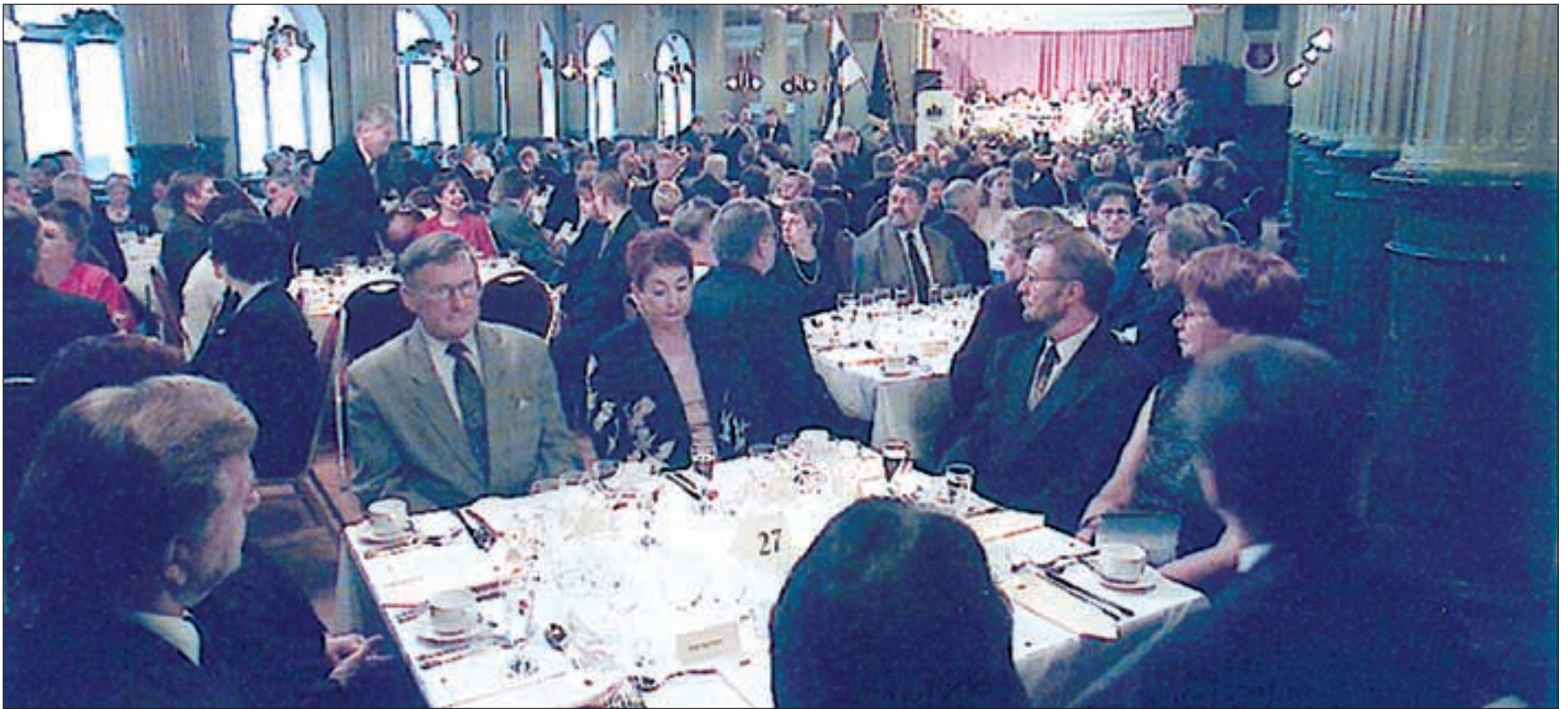
Juhlavieraita oli lähes kolmesataa.