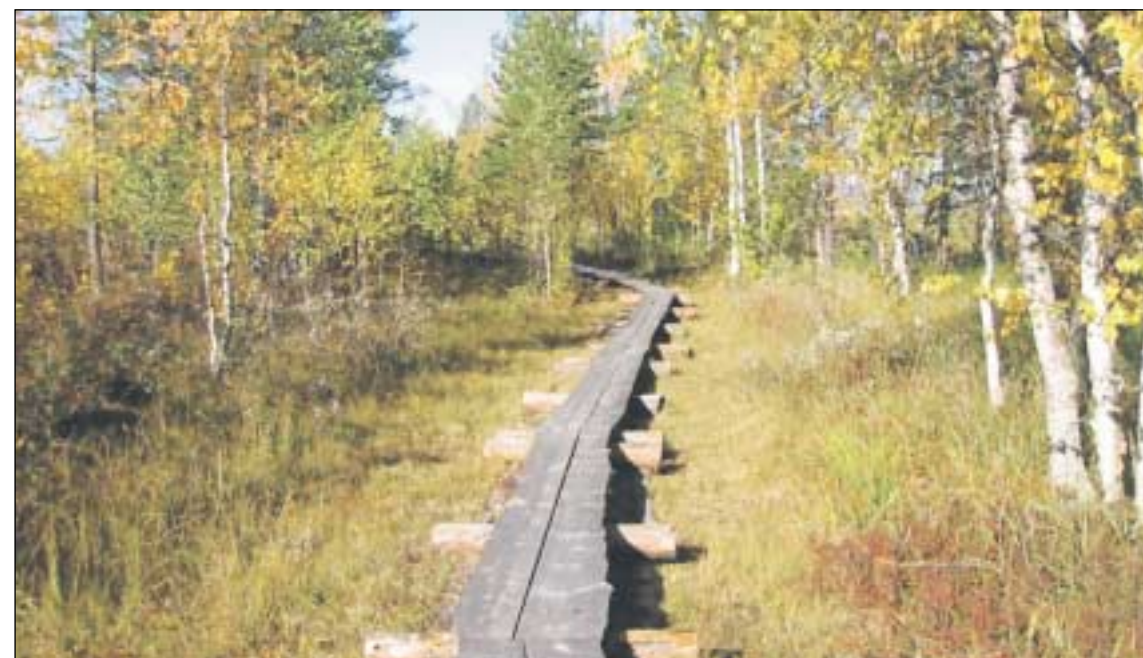
Pitkospuuta on kymmeniä kilometrejä vaellusreiteillä.