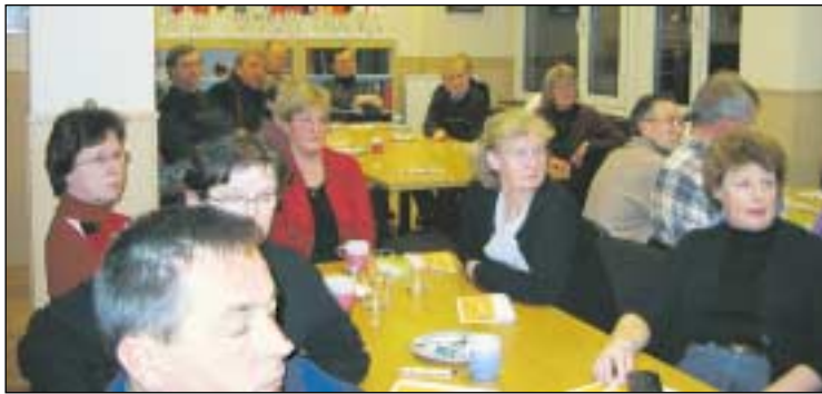
Eläketiedotustilaisuus pidettiin yhdistyksen toimistolla.

Työeläkkeet uudistuvat 1.1.2005. Muutokset koskevat eläkkeen karttumista, eläkkeen perusteena olevien ansioiden laskentaa sekä eläkevaihtoehtoja. Uusia eläkkeen laskentasaantöitä noudatetaan vuoden