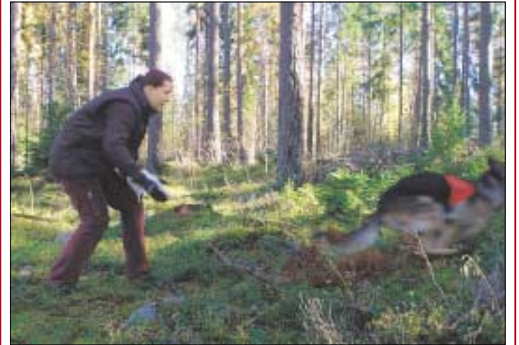
... ja motivaatio etsimisestä on oltava suuri. Vauhtia riittää.