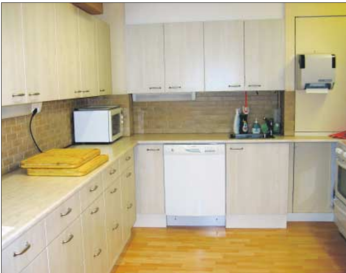
Yhdistyksen toimiston keittiötä on uudistettu ja huomattavasti laajennettu.