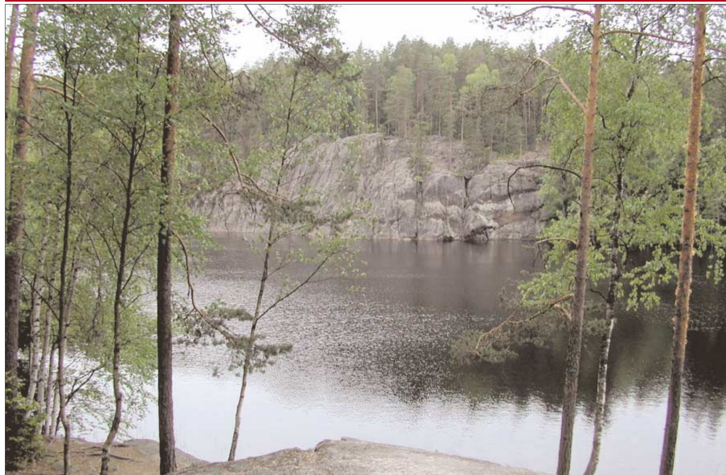
Järvimaisema Nuuksion kansallispuistossa Espoossa.

toon kuuluu monia Varsinais-Suomessa harvinaiseksi luokiteltuja lajeja, kuten nuolihaukka, tuulihaukka, kehrääjä, harvinaapäätikka, kangaskiuru ja pikkusieppo. Onnekas kulkija saattaa nähdä muuttohaukan suomännyn latvassa tai taivaalla lentämässä. Kurjenrahka on yksi riekon eteläisimmistä pesimäalueista Suomessa. Riekon ohella suon laidoilla kasvavissa pajukoissa ja rämeillä sinnittelevät myös maamme eteläisimmät pohjansirkut.