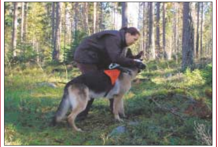
Koiralle näytetään suunta mihin sen on lähettävä eksynyttä etsimään...