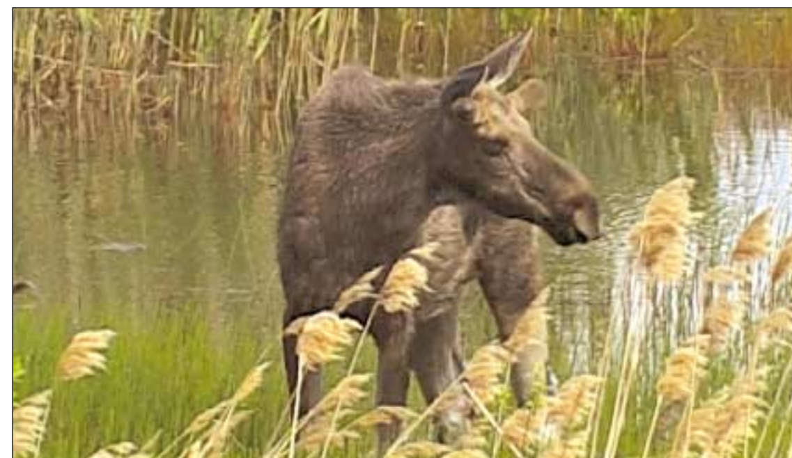
Hirvi on yleinen eläin Kurjenrahkan kansallispuistossa.