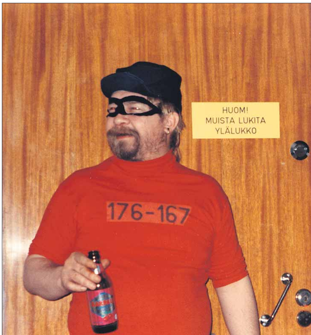
Myös karhukopla vierailee TKY:n suosituilla vappubrunssilla, on sitten lukot missä asennossa tahansa. Vappubrunssi järjestetään myös tulevana vuonna.

Vuoden 2007 yhdistyksen sääntömääräinen syyskokous pidetään lauantaina 1.12. ja saman päivän iltana ovat vuorossa taas pikkujoulet.